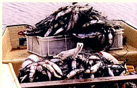
Røyskatt våker over dagens fangst.