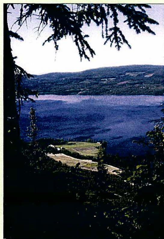
Utsikt mot Osensjøen.